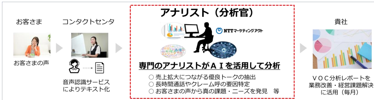
VOC分析サービスイメージ

音声マイニング技術であるVOCシステムを導入後、膨大な量の通話音声データを定量的・客観的に分析し、クライアントのコンタクトセンタが抱える様々な課題(売上拡大、応対品質向上等)の解決に向けたコンサルティング業務を実施します。